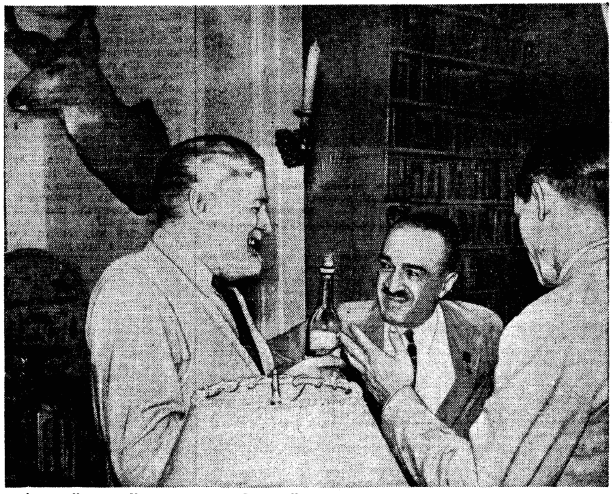
Анастас Иванович Микоян в гостях у Эрнеста Хемингуэя.

Мы растались с Эрнестом и Мари Хемингуэй в надежде встретиться вновь — на этот раз в Москве.