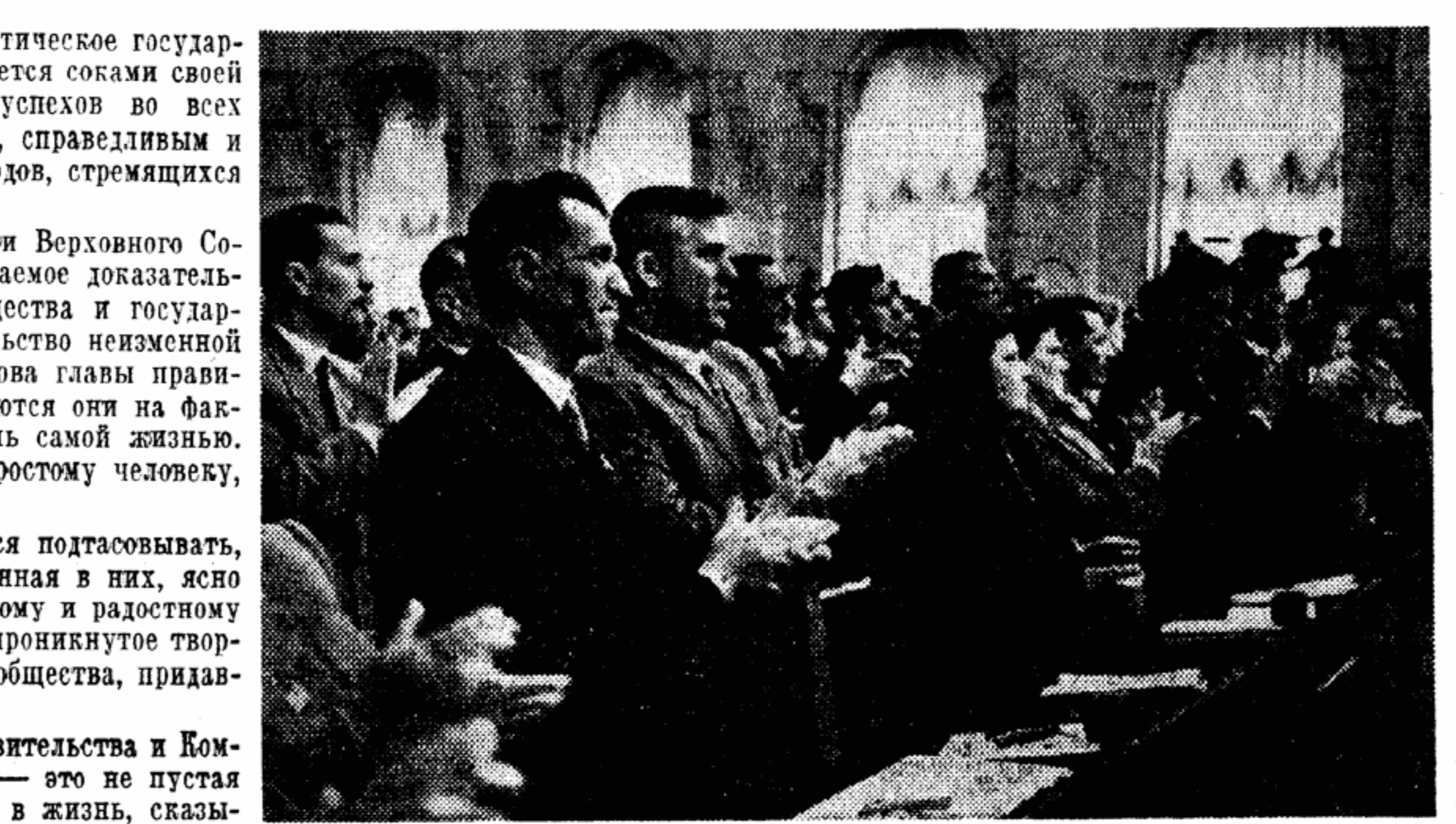
Пятая сессия Верховного Совета СССР пятого созыва. Депутаты приветствуют Никиту Сергеевича Хрущева.

Коммунисты ругают в странах доллара или фунта материалистами, влагая в